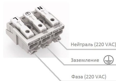
Рисунок 2 Схема подключения светильника